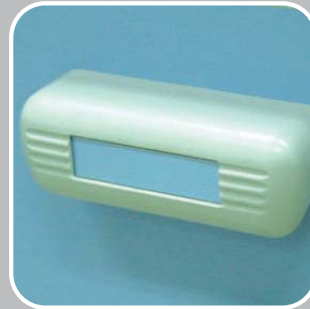
GRIFF AUS PP MIT IDENTIFIKATIONSÖFFNUNG