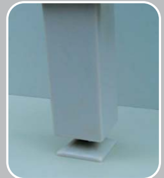
PP BEINE Hohe Tragfähigkeit, mechanisch PH widerstandsfähig Höhenverstellbar