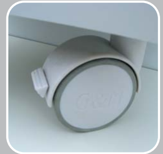
BREMSROLLE AUS PP