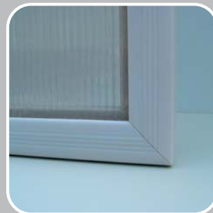
POLYKARBONAT IM ABS RAHMEN